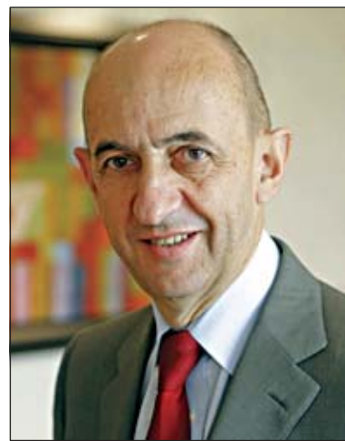
EADS-Chef Louis Gallois

Laut „Focus“ droht den Airbus-Beschäftigten jedoch Mehrarbeit ohne Lohnausgleich. Der Konzern wolle in Deutschland bei unverändertem Gehalt die Wochenarbeitszeit von 35 auf 40