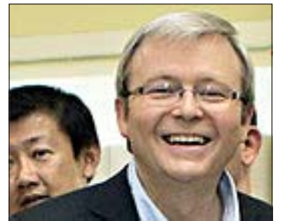
Der neue Ministerpräsident in Australien: Kevin Rudd

Der 68-jährige Howard lag das ganze Jahr über in den Meinungsumfragen hinter seinem 50-jährigen Herausforderer Rudd zurück. Rudd hat den Wählern einen Abzug der australischen Truppen aus dem Irak versprochen und angekündigt, das Kyoto-Protokoll zum Klimaschutz zu ratifizieren. Mit bei-